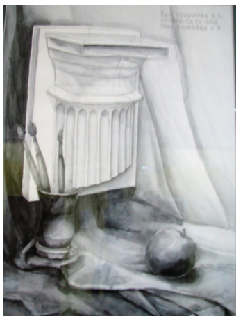
Учебные студенческие работы по рисунку и живописи. 2017–2018 уч. год, 1-й курс. Алтайский государственный университет

ния дизайнер должен владеть основами изобразительной грамоты, которые студенты получают на практических занятиях по рисунку и живописи, а также основам композиции и колористики [4].