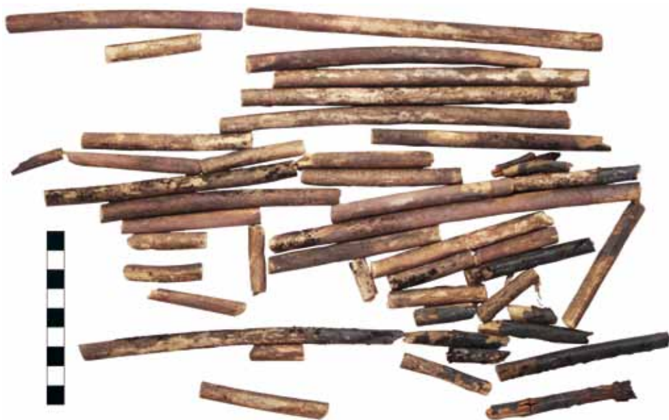
Рис. 4. Фрагменты деревянных древков стрел из Кызыл-Болчока

7. Два железных стремени (рис. 5.-3–4). Невыделенно-пластинчатые стремени имели заостренно-арочную форму. Края широких подножек опущены вниз. Одно стремя имеет размеры 13,5 \times 14 см, ширина подножки – 8 см. Размеры прорези под ремень – 2,5 \times 0,7 см. Второе стремя имело размеры 14 \times 13,5 см, ширина подножки – 7,3 см, размеры прорези под ремень – 2,6 \times 0,5 см.