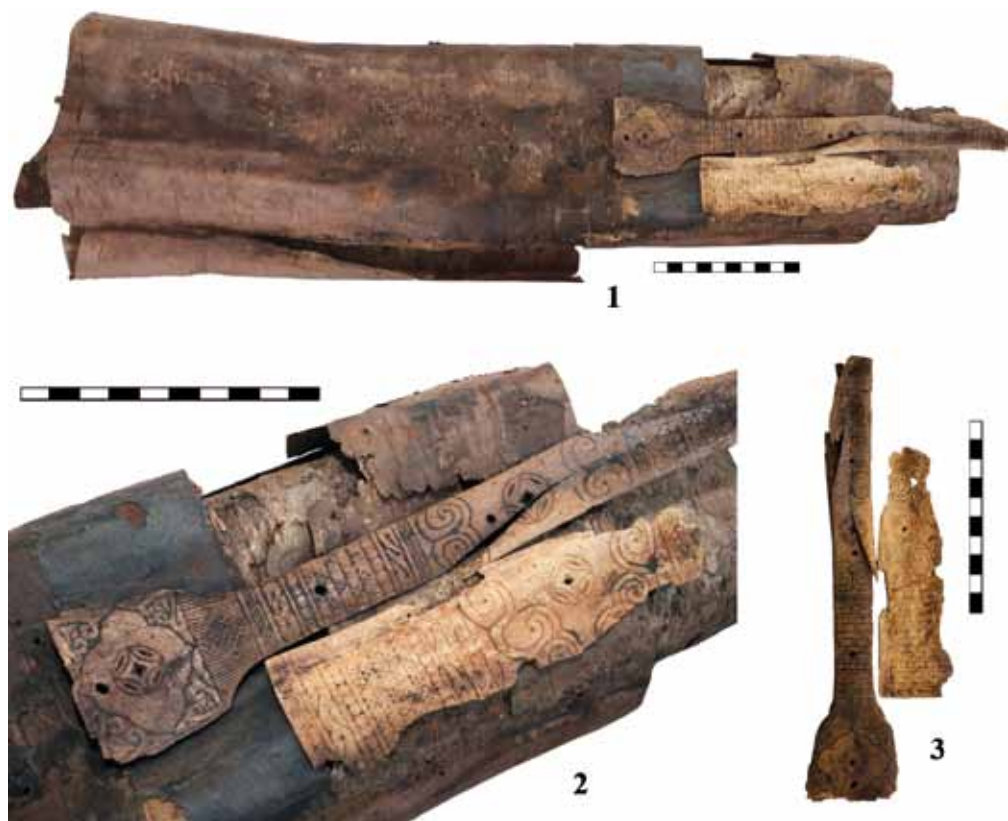
Рис. 2. Колчан из Кызыл-Болчока: 1 – общий вид колчана; 2 – фрагмент верхней части колчана с орнаментом; 3 – костяные пластины, украшавшие колчан

украшено четырехлепестковым узором, внутри которого вырезана розетка. Первоначально все прорезанные линии и вдавления были заполнены черным лаком, сохранившимся фрагментарно.