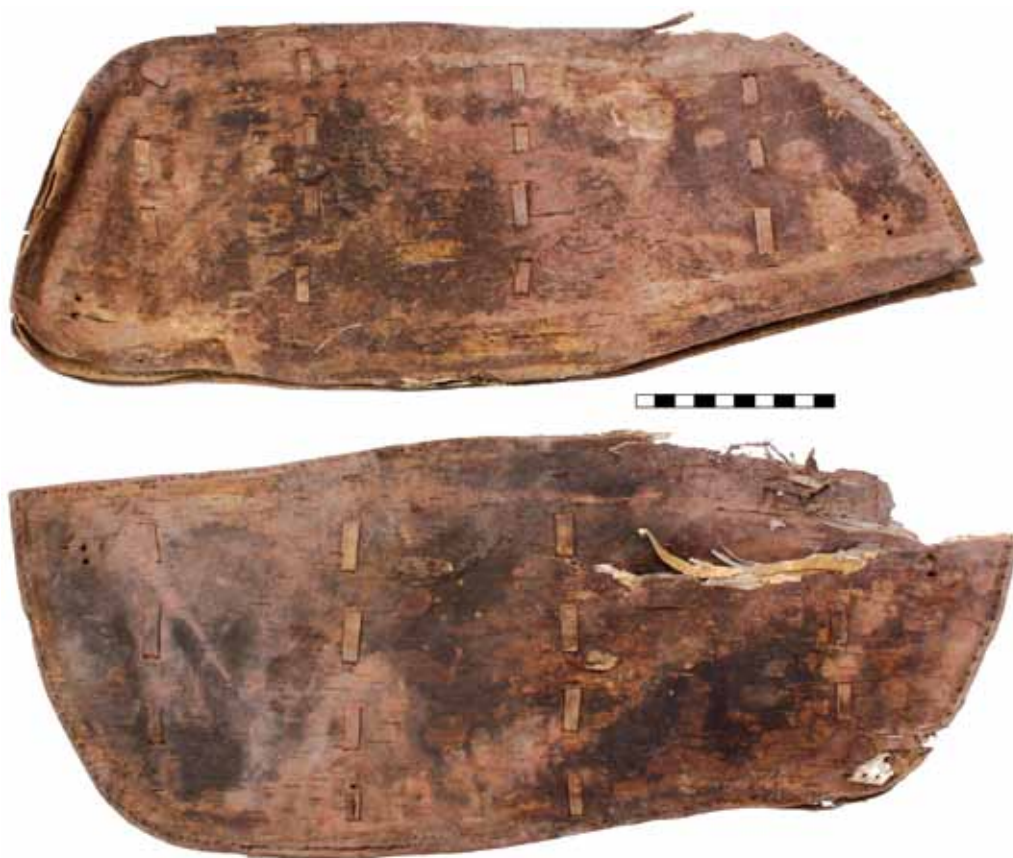
Рис. 6. Берестяные детали полок седла из Кызыл-Болчока

Найденный комплекс весьма перспективен для дальнейших исследований. В первую очередь необходимо произвести раскопки разрушенного погребения, целостность которого уже нарушена, что может привести к утрате оставленных в яме материалов. Остается надеяться на то, что находчики действительно оставили нетронутым основную часть погребения и планируемые аварийные раскопки объекта позволят уточнить и выявить новые сведения о комплексе в целом. После завершения исследования объекта находкам будет посвящена более подробная публикация. Комплекс может стать одним из опорных для характеристики материальной культуры населения Алтая монгольского времени.