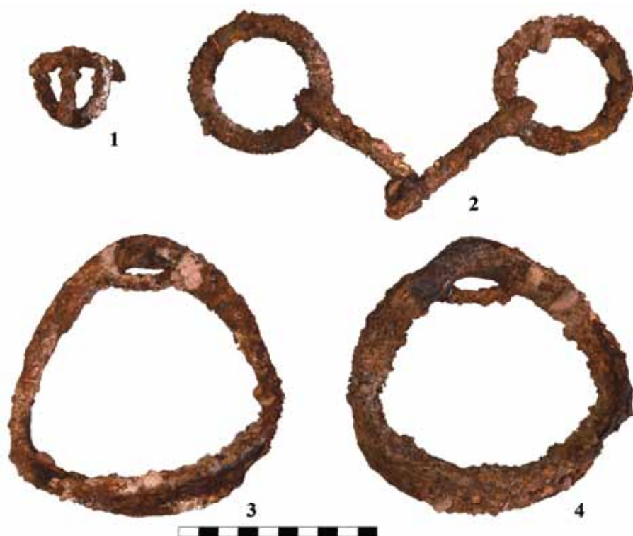
Рис. 5. Железные изделия из Кызыл-Болчока: 1 – пряжка; 2 – удила; 3, 4 – стремена

8. Железная пряжка (рис. 5.-1). Пряжка с подвижным язычком имеет рамку подтреугольной формы с немного выгнутым наружу основанием. Размеры пряжки – 4,2 \times 4,1 см, толщина – 0,7 см.