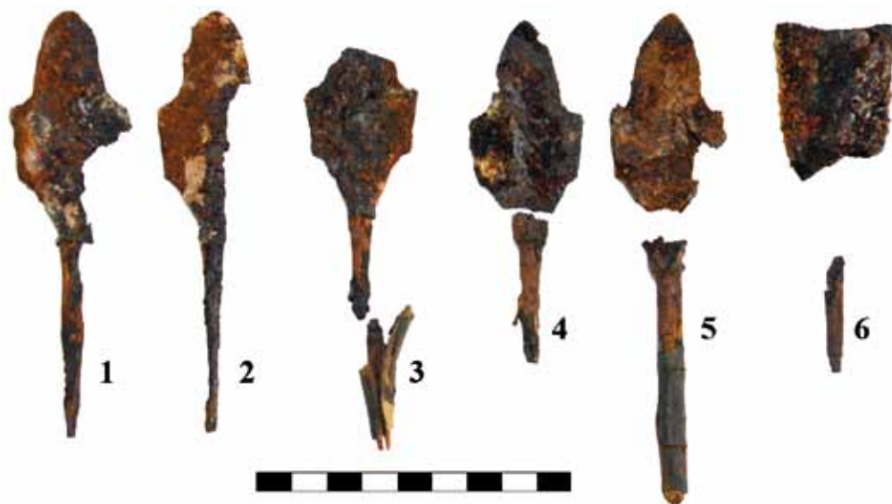
Рис. 3. Железные наконечники из Кызыл-Болчока