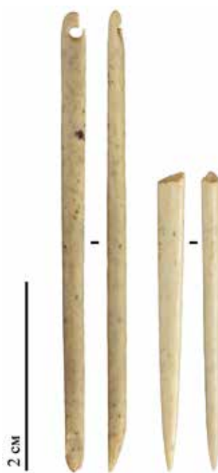
Рис. 2. Костяные иглы пещеры Страшной: 1 – игла с ушком из слоя 3 3 ; 2 – дистальный фрагмент иглы из слоя 3 1а

В проксимальной части иглы №1 на просверленном отверстии также фиксируются очевидные следы утилизации. Контур отверстия был деформирован продолжительным износом и сформирован под углом к продольной оси изделия (рис. 3). Также активное использование иглы привело к ослаблению одного из краев отверстия и последующему слою. Таким образом, после слома в дистальной части игла №1 продолжала использоваться, но была отбракована из-за вызванного износом слома ушка в проксимальной части.