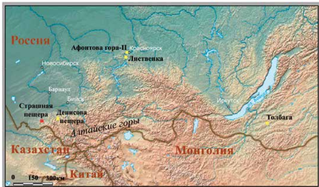
Рис. 1. Пещера Страшная на карте Южной Сибири и Забайкалья. На карте обозначены памятники верхнего палеолита, на которых были найдены костяные иглы с ушком

высотой около 6 м. По строению пещера простая горизонтальная, протяженностью около 20 м. С юго-запада к пещере примыкает терраса высотой 18–25 м от уреза реки, отделенная от пещеры скальным уступом. Специфическое расположение пещеры позволяет рассматривать ее как достаточно надежное временное убежище в древности.