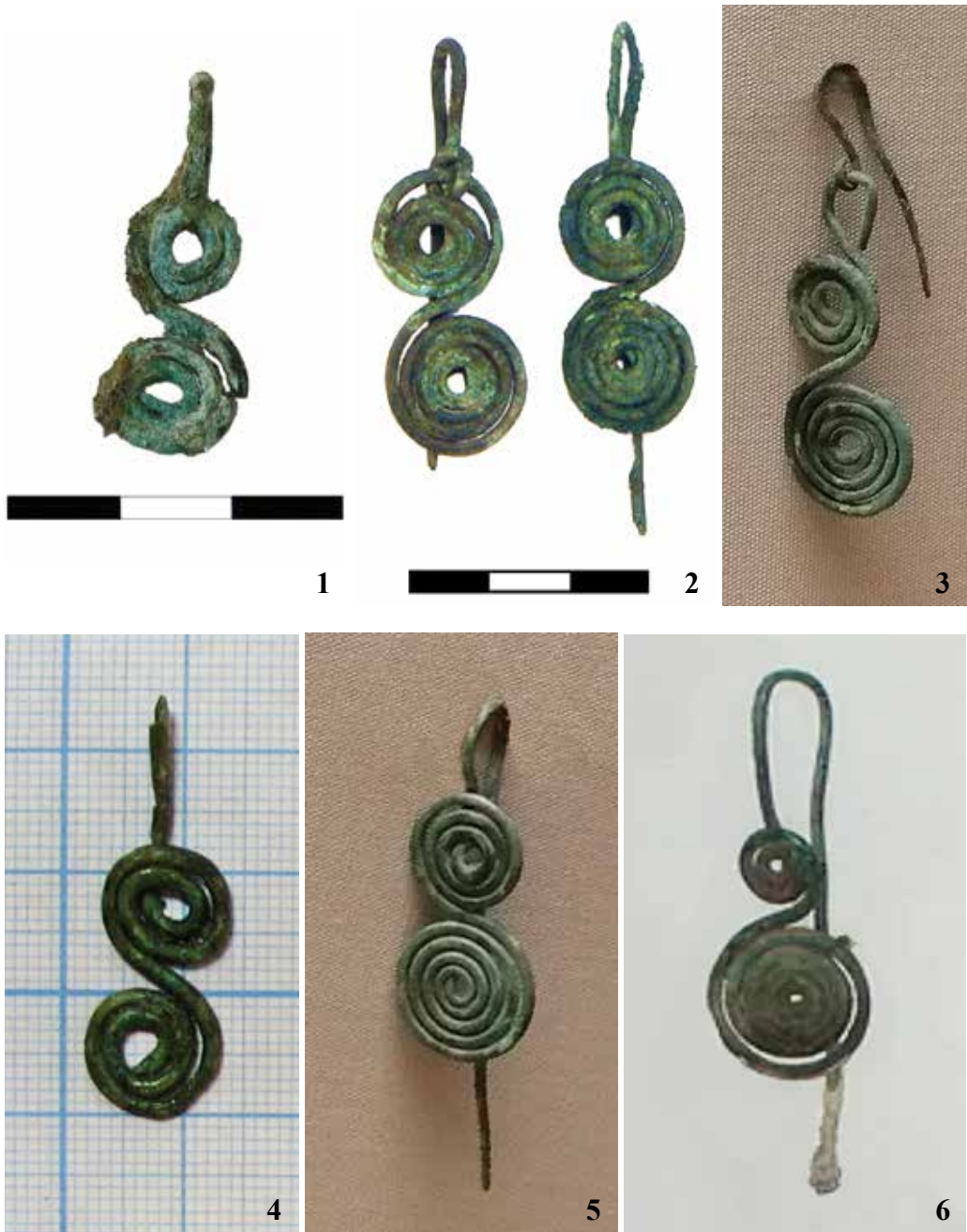
Рис. 2. Фото экземпляров бронзовых серег с основанием в виде плоской двойной спирали: 1 – Курайка, к. 48; 2 – Степушка-2, к. 22; 3 – Айрыдаш-1, к. 55; 4 – Айрыдаш-1, к. 81; 5 – Айрыдаш-1, к. 172; 6 – серьга из раскопок Ю.Т. Мамадакова в Центральном Алтае, выставленная в экспозиции Музея археологии и этнографии АлтГУ (URL: https://altarcheomuseum.wixsite.com/altai-archeology/hunno-sarmatian-time?lightbox=i01d55 )