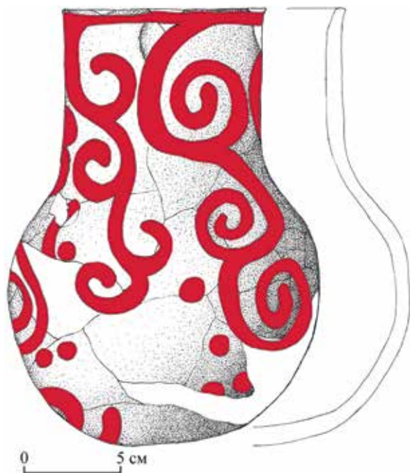
Рис. 7. Керамический сосуд из разрушенного погребения в с. Барагаш

можно, псалий был покрыт красной краской, следы которой сохранились на некоторых участках (рис. 6).