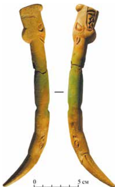
Рис. 5. Роговой псалий из разрушенного погребения в с. Барагаш