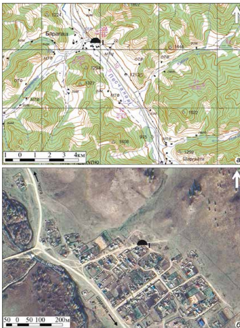
Рис. 2. Расположение разрушенного погребения в с. Барагаш на участке карты долины р. Песчаная (а) и спутниковом снимке (б)