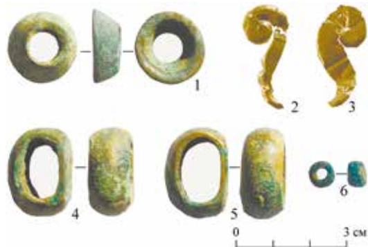
Рис. 4. Детали конского снаряжения и украшения из разрушенного погребения в с. Барагаш