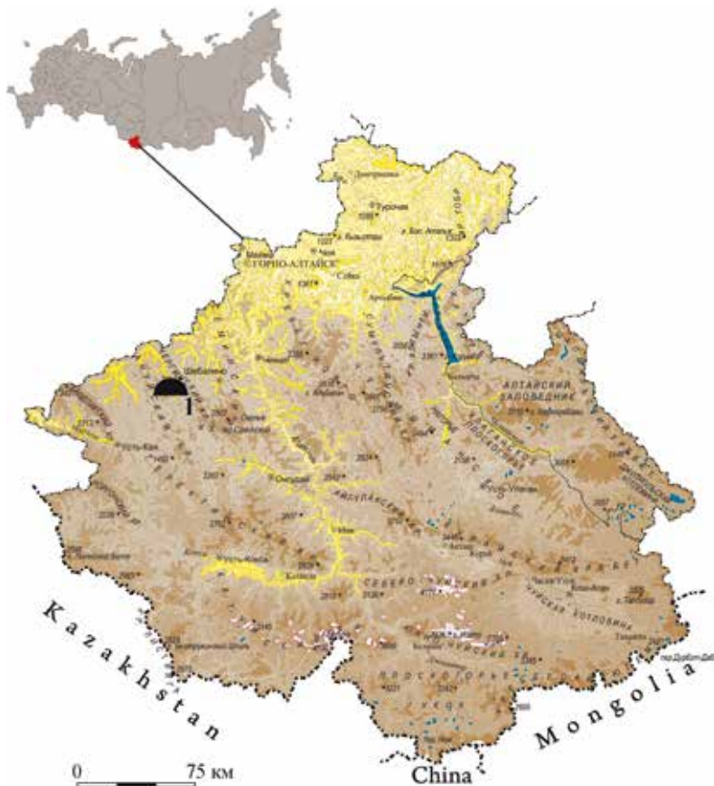
Рис. 1. Расположение разрушенного погребения в с. Барагаш на карте Республики Алтай действительно находятся три крупных земляных (?) кургана, которые имеют следы раскопок. На наш взгляд, упоминания исследователей касаются именно этих объектов. Изучение архивных материалов, возможно, позволит выяснить историю, связанную с раскопками указанных курганов.

Имеются также данные и о других разнотипных и разновременных комплексах, расположенных в окрестностях села. В ходе целенаправленных поисков поселенческих памятников П.И. Шульгой [2015б, с. 208] в 1987 г. обнаружены два поселения рядом с Барагашом. В 1989 г. на этом участке долины В.Н. Елин осматривал петроглифы, нанесенные на скальные выходы по обоим берегам р. Песчаная [Кубарев, Маточкин, 1992, с. 22]. В разные годы на памятниках долины р. Песчаная проводились разведочные работы под руководством В.И. Соенова, в ходе которых был зафиксирован целый ряд археологических комплексов [Соенов, Ойношев, 2006; Соенов и др., 2012]. В 2004 г. на могильнике Нижний Айры-Таш, расположенном к западу от с. Барагаш, экспедицией АКИН РА раскопаны два погребения афанасьевской культуры [Вдовина, 2004]. Известны также найденные у Барагаша два тюркских каменных изваяния, одно из которых можно определить как «классическую» воинскую статую [Кубарев, 1984], другое является уникальным для региона. Оно определяется специалистами как женское [Худяков, Белинская, 2012].