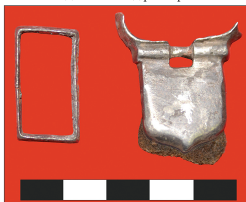
Рис. 5. Мусохраново-1. Кургan №4. Могила-3. Тренчик и пряжка

Изделия декорированы растительно-геометрическим орнаментом, оформленным парными нервюрами, проходящими по длине украшения и образующими декоративный ромб в центре, и симметрично расположенными растительными элементами, так называемыми полупальметтами. Подобное растительно-геометрическое оформление характерно в большей степе-