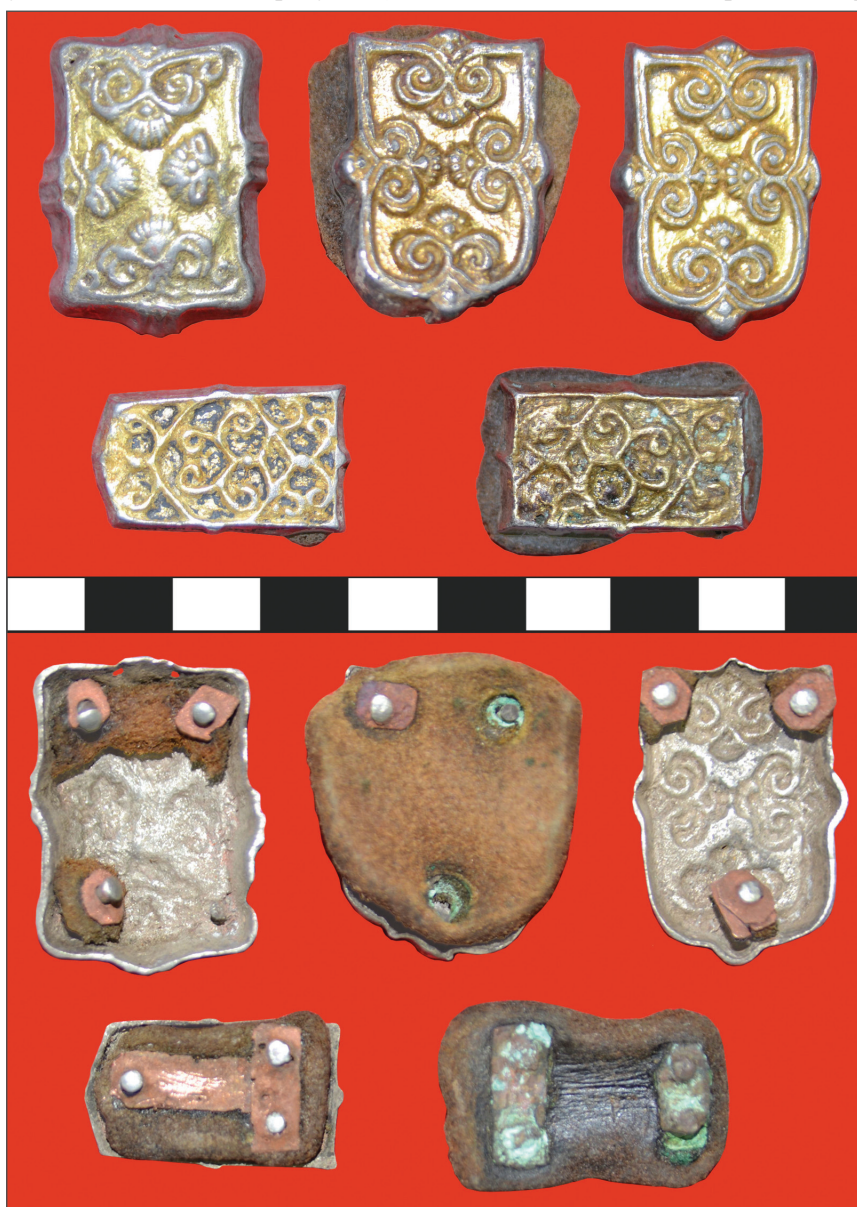
Рис. 3. Мусохраново-1. Курган №4. Могила-3. Украшения конской узды (цветной металл, кожа)

модели со вставкой (сердечником). Вероятно, что в цепочке отливок таких предметов рассматриваемый наконечник и бляха находились в группе первичных, о чем свидетельствуют четкие отпечатки рисунка (как на лицевой, так и на оборотной стороне).