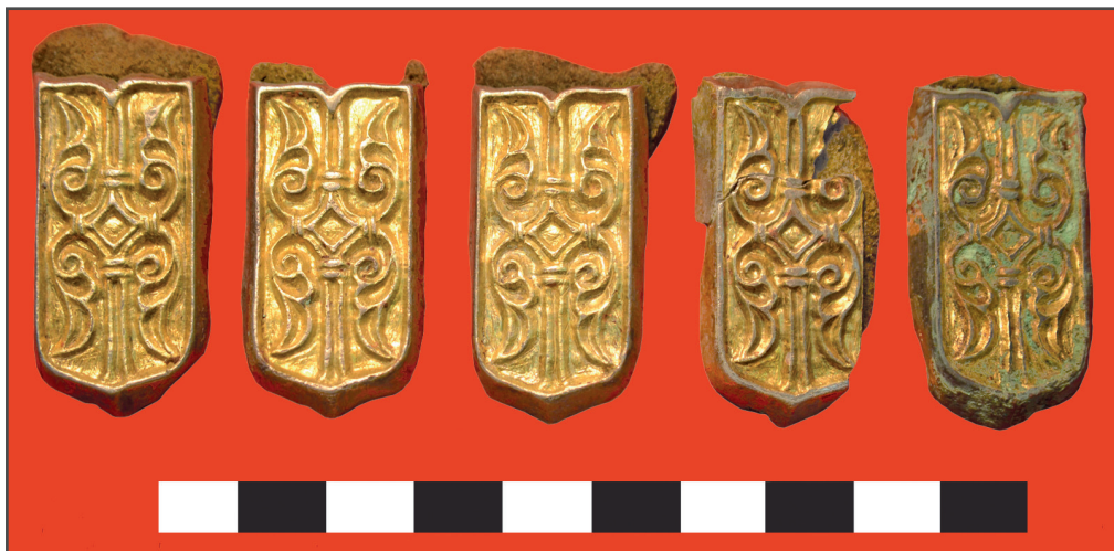
Рис. 2. Мусохраново-1. Курган №4. Могила-1. Наконечники ремней (цветной металл, кожа)

тели рубежа VIII/IX – 1-й половины X в. из кургана №5 комплекса Корболиха-VIII [Могильников, 2002, рис. 216.-4, 7–8; Горбунова, 2010, с. 61, рис. 28.-11]. В качестве своеобразного прототипа этого орнаментального мотива можно рассматривать изделия, морфологические детали которых имеют схожее оформление, например, лопасти распределителей ремней, оформленные в виде гроздей винограда и датирующиеся 2-й половиной VIII – 1-й половиной IX в. [Горбунова, 2010, с. 61, рис. 28.-8].