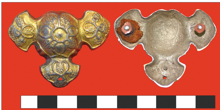
Рис. 4. Мусохраново-1. Кургan №4. Могила-3. Распределитель ремней (цветной металл, кожа)

форме и декору изделия происходят из памятников шандинской культуры Кузнецкой котловины [Тишкин, Илюшин, 2010, с. 95, рис. 1], в материалах сrostкинской культуры Алтая [Уманский, 1991, рис. 1; Тишкин, 1991, рис. 1.-3; Телегин, 2001, рис. 44; Боровков, 2001, рис. 3; Алтай в зеркале веков, 2001, с. 60; Могильников, 2002, рис. 54.-3, 86.-15; Горбунова, 2010, с. 55, рис. 24; с. 59, рис. 27], в комплексах кыргызской культуры Минусинской котловины и Тувы [Евтюхова, 1948, рис. 130; Киселев, 1949, табл. LXI.-1; Нечаева, 1966, с. 126, рис. 12.-1–2; Кызласов, Король, 1990, рис. 36.-1; 37.-1–3, 5–7], а также представлены в находках из гробниц киданей [Каогу, 1987, с. 897; Раскопки гробницы Елюй Ючжи..., 1996, с. 19–20; Горбунова, 2005, рис. 1, 2]. Последние из перечисленных аналогий отличаются наиболее насыщенным характером декора.