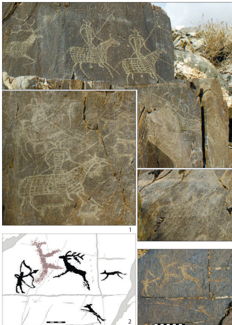
Рис. 2. Хар-Хад (Ховдский аймак Монголии): 1 – изображения катафрактов, фото 2011 г.; 2 – плоскость со сценой охоты, прорисовка и фото 2013 г. Fig. 2. Khar-Khad (Khovd aimag of Mongolia): 1 – images of cataphracts, photo of 2011; 2 – plane with a hunting scene, drawing and photo of 2013

В настоящее время помимо открытия ранее не известных образов в раннесредневековом наскальном искусстве Монголии [Мухарева, Мунхбаяр, Сухбаатар, 2018, с. 74–76] (рис. 1) большое значение имеет повторное обследование уже известных комплексов наскального искусства с целью детальной фиксации изображений. Так, в 2011 и 2013 гг. участниками Буянтской российско-монгольской археологической экспедиции в рамках документирования петроглифов известного местонахождения Хар-Хад (рис. 2.-1), обследования прилегающих к нему окрестностей и выборочных раскопок отдельных