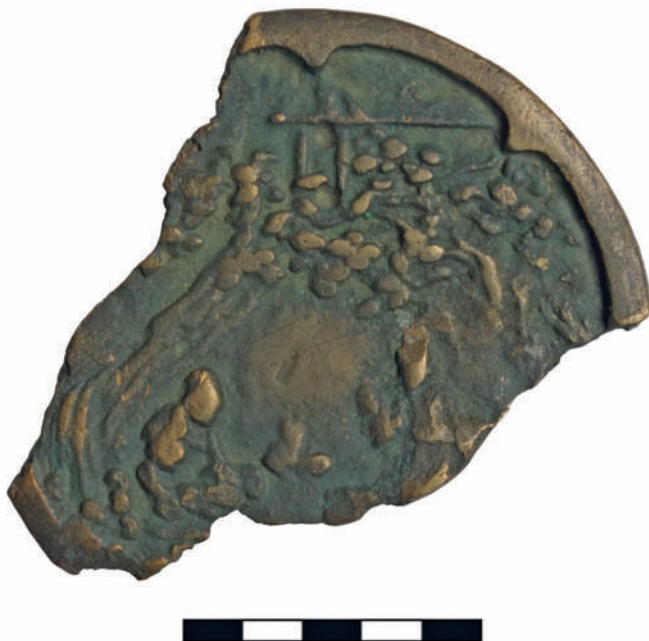
Рис. 1. Фрагмент металлического зеркала из собрания Национального музея Республики Тыва.

Публикуемая находка является фрагментом металлического зеркала (рис. 1–2). Судя по сохранившейся части изделия, предмет представлял собой округлый диск диаметром 11,5 см и толщиной до 0,5 см. Вероятно, в центральной части зеркала изначально была ручка-петля, от которой сохранилась заметная затертость.