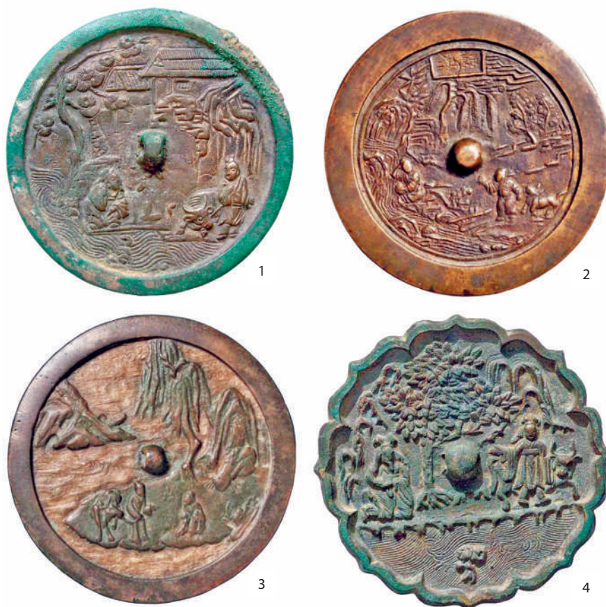
Рис. 4. Металлические зеркала с вариантами композиции с сюжетом «Сюй Ю и Чао Фу» (по: 1 – [И Баоли, Ван Юйлан, 2001, с. 51]; 2 – [Зеркало «История о...»]; 3 – [Чжан Дун, 2011, с. 92]; 4 – [Ли Цян, 2009, с. 129])

Судя по имеющимся сведениям, сюжет, демонстрирующий сцену беседы «Сюй Ю и Чао Фу», появился в орнаментации металлических зеркал в период династии Сун. Однако в начальный период распространения он композиционно и стилистически изображался по-другому, хотя на изделиях также присутствуют река, теленок, дерево и два персонажа. Представляется возможным выделить несколько различных композиционных вариантов воплощения данного сюжета (рис. 4), интерпретация специфики которых требует проведения отдельного исследования.