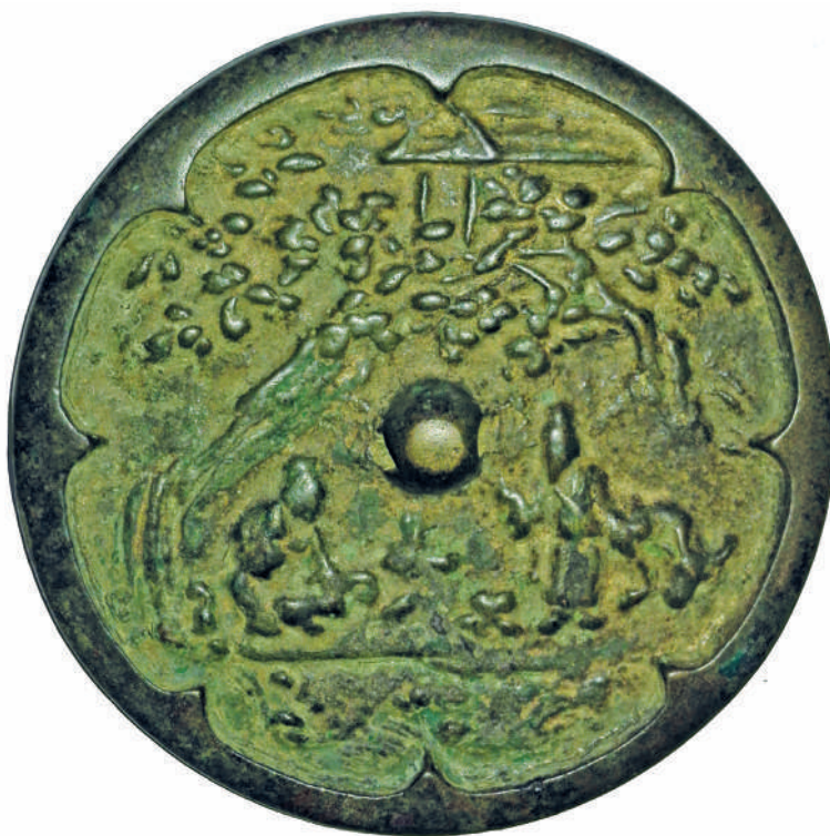
Рис. 3. Металлическое зеркало с изображением сцены беседы «Сюй Ю и Чао Фу» (по: [Зеркало династии Ляо и Цзинь...])

Все обозначенные атрибуты фиксируются и в изображении, сохранившемся на публикуемом фрагменте, — пара фигур и дерево. Поэтому для общей трактовки композиции и сюжета необходимы дополнительные элементы. В случае с находкой из Тувы это оказалось довольно затруднительно, так как в нашем распоряжении имеется только центральная часть зеркала без сопутствующих «компонентов». Отличительными особенностями композиции на анализируемом фрагменте являются «согнутое дерево» и контур дома (беседки). На большинстве других схожих зеркал данной группы изображены прямые деревья.