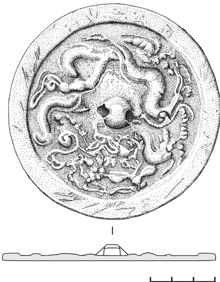
Рис. 5. Металлическое зеркало из собрания АГКМ. Рисунок выполнен А. Л. Кунгуровым

ры нами не выявлены. Не исключено, что в данном случае прототипом являлось изображение «ленты счастья» / «узла счастья» 绶带, которые символизируют долголетие и счастливый брачный союз. Другим вариантом интерпретации зафиксированного сюжета может быть сопоставление его с изображением лотоса позднего периода династии Юань или Мин. Так или иначе, подобные зеркала в археологических памятниках Северной и Центральной Азии, насколько нам известно, до сих пор не обнаружены. На то, что данное изделие не является китайским, а скорее связано с другими центрами производства, указывает узкий бортик, цвет металла и система орнаментации. Хронология зеркала определяется временем сооружения погребений комплекса Хорошонок-I, которые на основании времени бытования обнаруженных предметов инвентаря датируются в рамках IX–X вв. н.э.