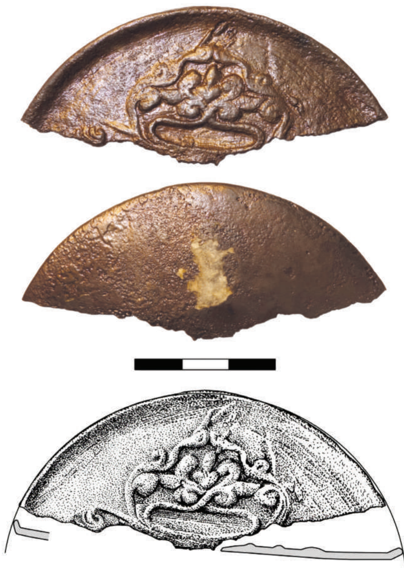
Рис. 3. Металлическое зеркало из комплекса Хорошонок-1. рисунок выполнен А. Л. Кунгуровым Fig. 3. Metal mirror from the Khoroshonok-1 complex. drawing by A. L. Kungurov

В сохранившейся части зеркала представлена фигура, напоминающая растительные побеги. Общий абрис изображения на зеркале напоминает рисунки, нанесенные на бляхи, получившие распространение в материальной культуре кыргызов [Король, 2008, с. 283, табл. 23.-1–16]. Однако полные аналогии внутреннему наполнению фигу-