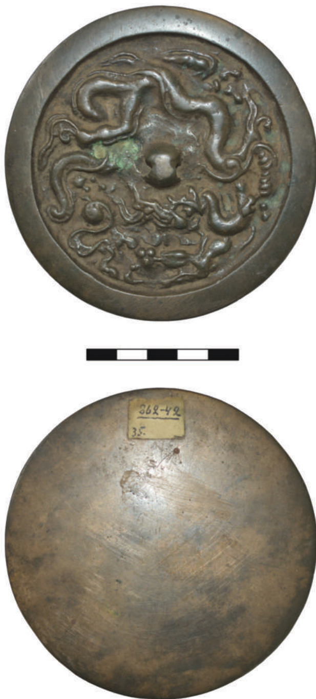
Рис. 4. Металлическое зеркало из собрания АГКМ. Fig. 4. Metal mirror from the AGKM collection.