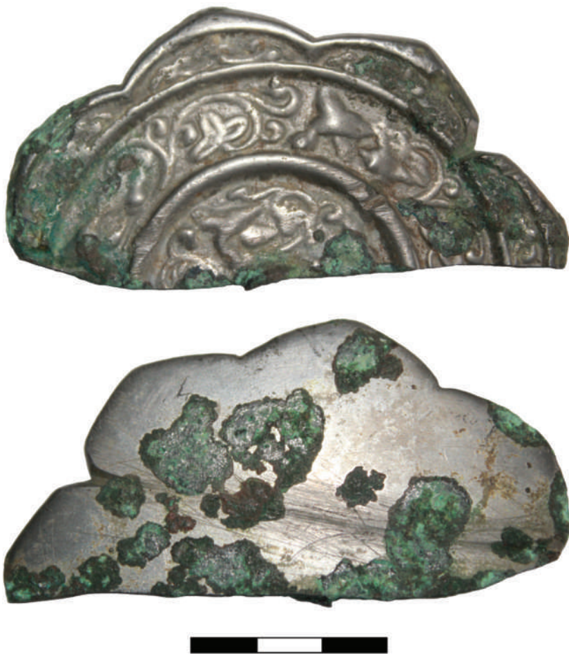
Рис. 1. Металлическое зеркало из комплекса Кирилловка-V. Фото авторов Fig. 1. Metal mirror from the Kirillovka-V complex. Photo by the authors

Кирилловка-V (ОФ 15367/34) (рис. 1–2). Предмет представляет собой фрагмент зеркала. Размеры оставшейся части изделия — 8,7×4,3 см, толщина — до 0,3 см. Поверхность зеркала покрыта патиной, в отдельных местах имеется коррозия. На обеих сторонах предмета хорошо видны следы пропилов.